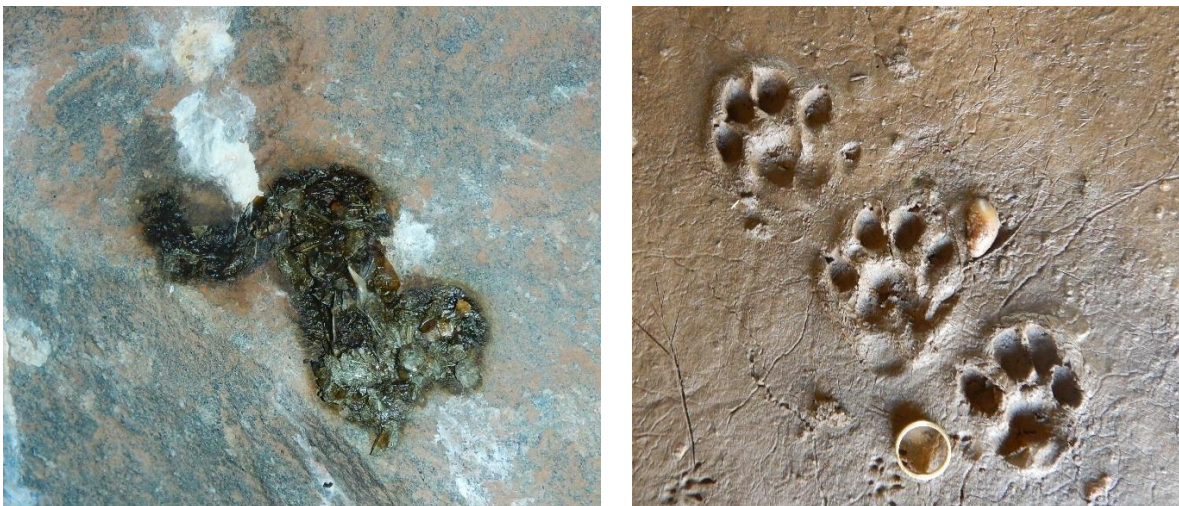
Abbildung 3: Losung und Trittsiegel (der Ring hat einen Durchmesser von 2 cm)

Das Trittsiegel des Fischotters ist relativ groß, die Breite zwischen den beiden äußeren Zehen sollte mindestens 5 cm betragen, es kann auch bis 8 cm breit sein. Es sollten 5 Zehenabdrücke zu sehen sein, wobei die kleinste Zehe oft undeutlich abgedrückt ist. Diese sind im Gegensatz zum Waschbär (der sehr ähnliche Trittsiegel hat) eher rundlich ausgeprägt. Die Pfotenballen sind bei guten Abdrücken gegliedert (beim Waschbär sind sie NICHT gegliedert). Insgesamt wirkt das Trittsiegel rundlich, die Krallenabdrücke sind selten zu sehen, ebenso sieht man auch fast nie die Schwimmhäute. Verwechslungsgefahr besteht in erster Linie mit dem Waschbär. Beim Fotografieren von Spuren sollte immer ein Maßstab danebengelegt werden und ohne Blitz fotografiert werden.