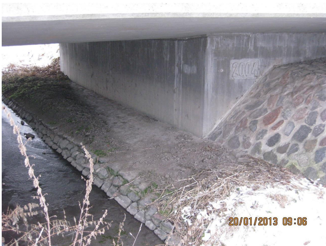
Abbildung 1: Gut geeignete Brücke für die Suche nach Nachweisen

Hierfür werden pro UTM 10 x 10 km Quadrat 4 Probestellen festgelegt. Pro Quadrant (5 x 5 km) sollte eine Probestelle vorhanden sein. Bei den Probestellen handelt es sich häufig um Brücken. Diese Probestellen werden auf Anwesenheit des Otters untersucht. Als sichere Nachweise gelten dabei nur Losung und Trittsiegel (siehe Kap. 3). Fraßreste und Wechsel sind zu unspezifisch und werden nicht gewertet. Findet man am Startpunkt keine Nachweise, sollen weitere 600 m des Gewässers abgesucht werden. Letztere Vorgabe wird in Thüringen nicht angewendet, hier werden lediglich die festgelegten Punkte (fast immer Brücken mit Uferstreifen) abgesucht. Brücken eignen sich besonders gut als Suchpunkte, da Otter hier oft das Wasser verlassen und die Uferstreifen (Bermen) zum Markieren mit Losung nutzen und so auch Trittsiegel hinterlassen (Abb. 1). Zudem sind Brücken gut für den Kartierer erreichbar und es kann mit rel. wenig Aufwand ein großes Gebiet kartiert werden. Da die Markierungsaktivität im Winterhalbjahr am höchsten ist, werden Kartierungen meist zwischen September bis März durchgeführt. In Thüringen werden die Untersuchungen jedes Jahr durchgeführt, so dass sich mittlerweile ein gut belegtes Bild der Wiederbesiedlung ergibt.